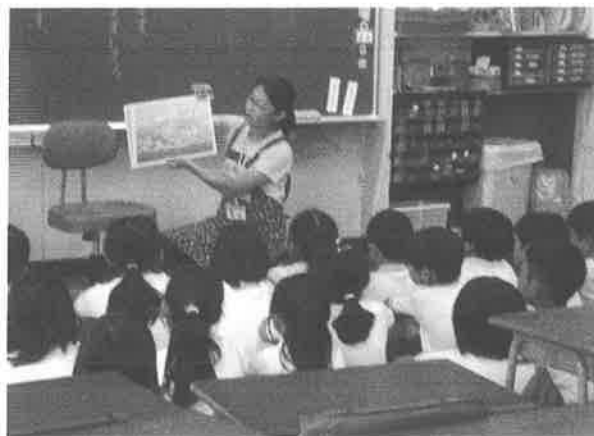
クラスでの読み聞かせの様子

興味のある方は、ぜひ、学校より配布された「オール明峰サポーター登録について」のお手紙にて登録の申込みをお願いいたします！