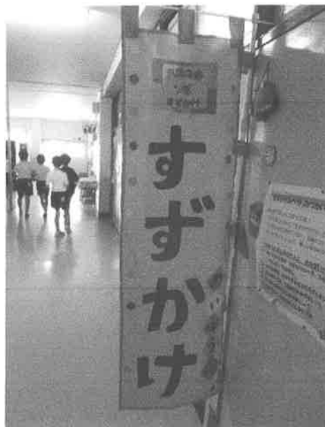
すずかけルームは、北校舎1階の2年生の教室のとなりにあります